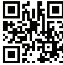
Clarity 3D Solver

Cadence Clarity 3D Solver 是一款 3D 電磁 (EM) 模擬軟體工具，用於設計 PCB、IC 封裝和 IC (SoIC) 系統設計的關鍵互連。