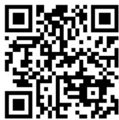
映陽科技官方網站

英華達所採用的 Allegro、Sigrity X 和 Clarity 3D 解決方案均由 Cadence 台灣官方代理商 Graser 映陽科技 團隊提供專業技術支援與服務，協助 IAC 設計團隊及時解決 SI/PI 問題，迅速完成產品合規驗證，減少設計重製，按時交付高品質產品。